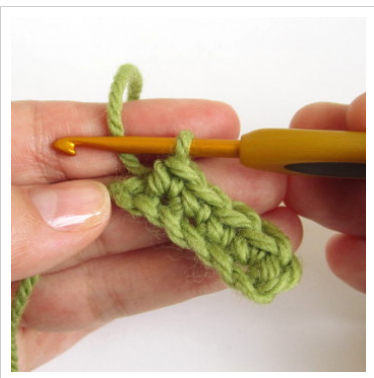
4. Üks kinnissilmus kolme järgmisesse silmusesse.