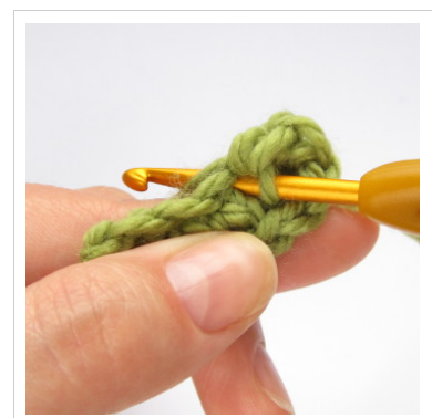
6. Keera ja heegelda ahelsilmustesse teiselt küljelt.