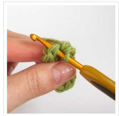
9. Ära ühenda ringi vaid alusta kohe uue ringi heegeldamist.