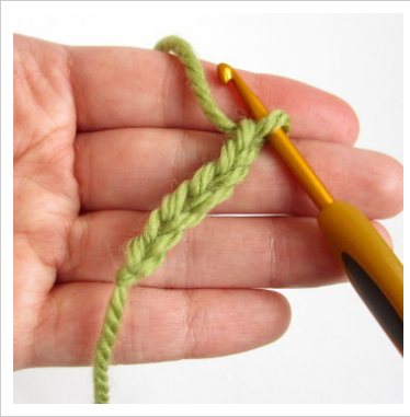
1. Heegelda kuus ahelsilmust. Sellest saab esimese ringi põhi.

1: 6 ahelsilmust, 2 ks heegelnõelast teise silmusesse, ks x 3, 4 ks viimasesse silmusesse Keera ja heegelda ahelsilmustesse teiselt küljelt. ks x 3, 2 ks esimesse silmusesse. Ära ühenda ringi.