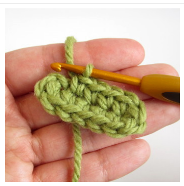
7. Üks kinnissilmus kolme järgmisesse silmusesse.