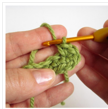
5. Heegelda neli kinnissilmust viimasesse silmusesse.