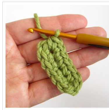
8. Kaks kinnissilmust esimesse silmusesse (kokku neli silmust).