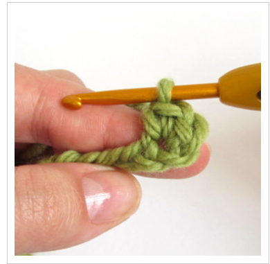
3. Heegelda sellesse silmusesse kaks kinnissilmust.